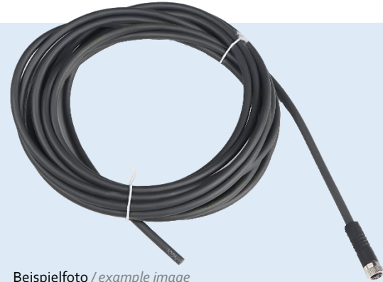
Beispielfoto / example image

Connection cable M8 4-pole, 5 m long. For connecting planistar lights with a 4-pin M8 connector.