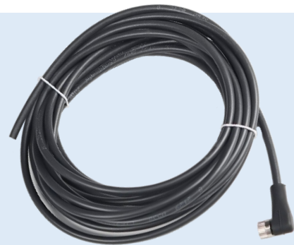
Beispielfoto / example image

Connection cable M8 4-pole, angled, 5 m long. For connecting planistar lights with a 4-pin M8 connector.