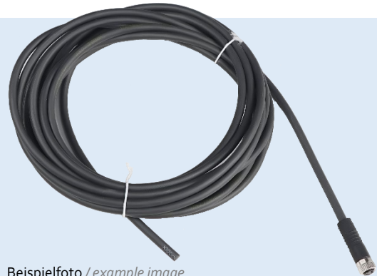
Beispielfoto / example image

Connection cable M8 4-pole, 10 m long. For connecting planistar lights with a 4-pin M8 connector.