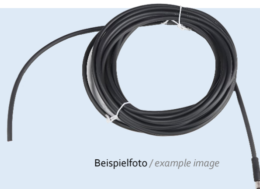
Beispielfoto / example image

Connection cable M5 4-pole, 5 m long. For connecting planistar lights with a 4-pin M5 connector.