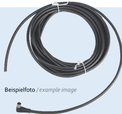
Beispielfoto / example image

Connection cable M5 4-pole, angled, 5 m long. For connecting planistar lights with a 4-pin M5 connector.